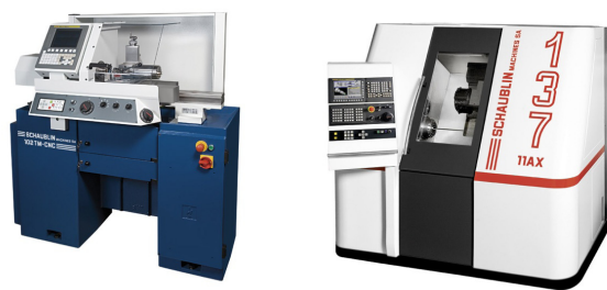
Die Schaublin 102 TM-CNC (links) sowie das Drehzentrum 137-11 AX stehen unter anderem im Messfokus der Turning-Days.

höchste Präzision bei Bohr-, Schlicht- und Schruppbearbeitungszyklen auch bei kleinsten Abmessungen sowie das Drehzentrum 137-11 AX mit 11 Achsen im Messfokus. Ein weiterer Messeschwerpunkt werden die speziellen Schaublin Spannmittel aus Schweizer Produktion sein.